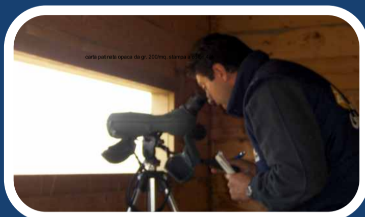
Itinerario pedonale con birdwatching