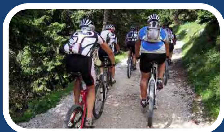
Escursioni in bici