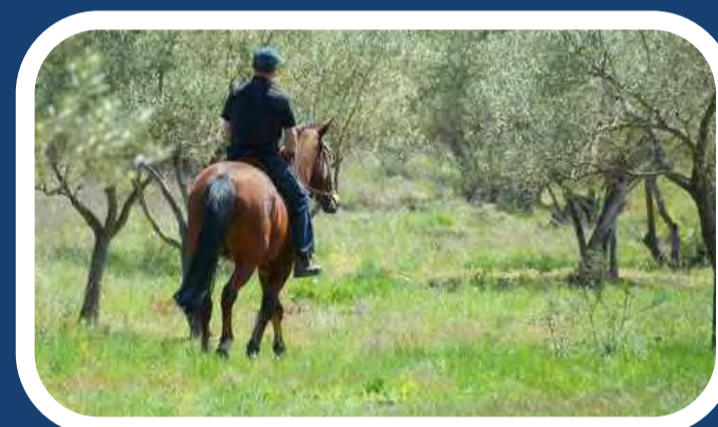
Escursioni a cavallo